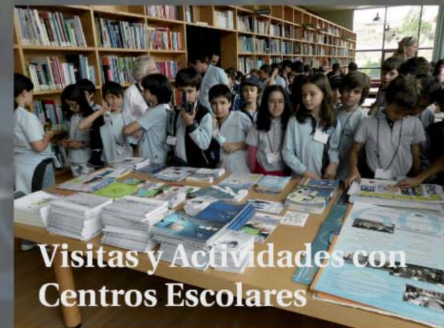
Visitas y Actividades con Centros Escolares