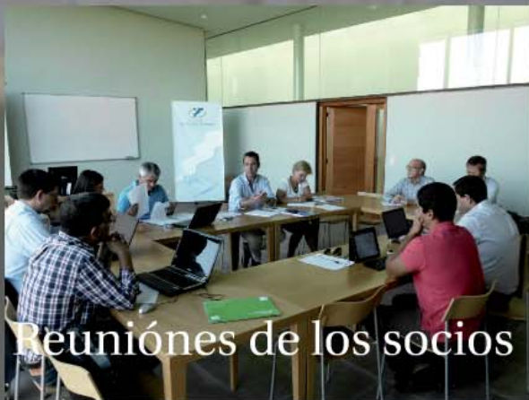
Reuniones de los socios

Consolidar la promoción transfronteriza empresarial en las regiones Centro y Norte de Portugal y Castilla y León