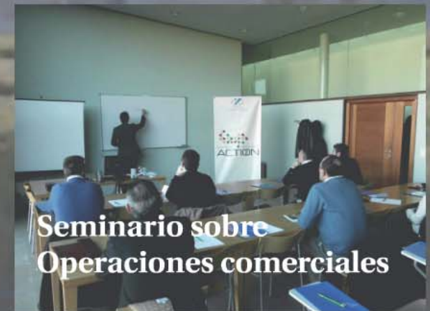
Seminario sobre Operaciones comerciales