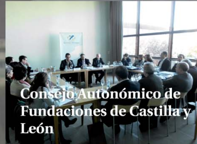
Consejo Autonómico de Fundaciones de Castilla y León