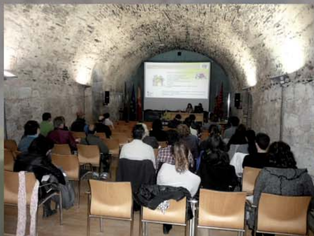
Jornadas sobre Movilidad laboral en europea