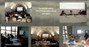
Centro de Documentación, Punto de Información Europea