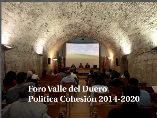
Foro Valle del Duero Política Cohesión 2014-2020