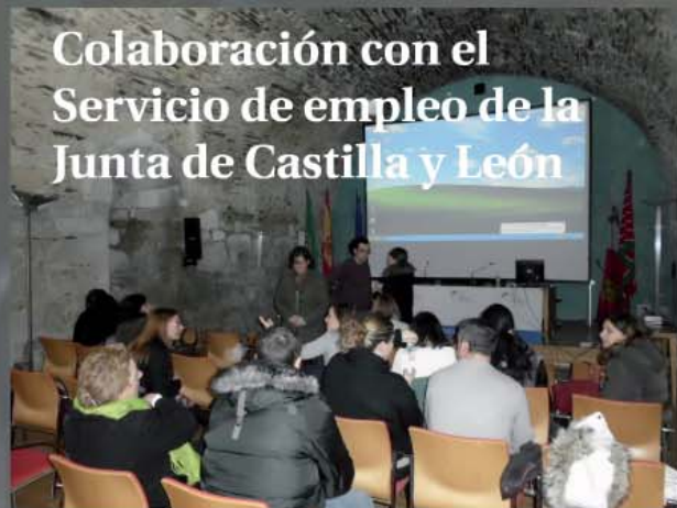
Colaboración con el Servicio de empleo de la Junta de Castilla y León