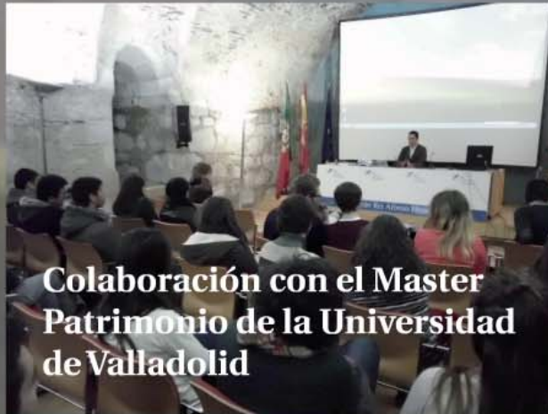
Colaboración con el Master Patrimonio de la Universidad de Valladolid