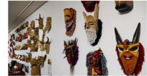
MOSTRA COLETIVA MÁSCARA, O OUTRO EU [de 7 de dezembro de 2023 a 22 janeiro de 2024]